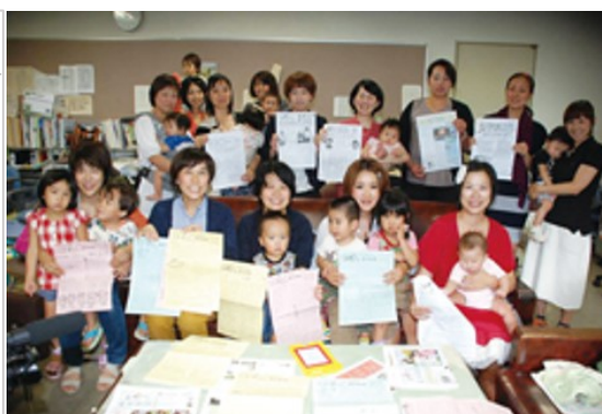
「わたし版」編集長たち