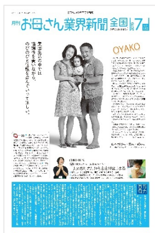
「お母さん業界新聞 全国版」「お母さん業界新聞わたし版」