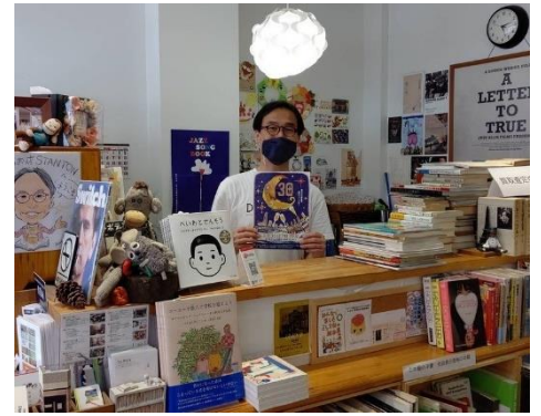
本の店スタントンさん（大阪市）