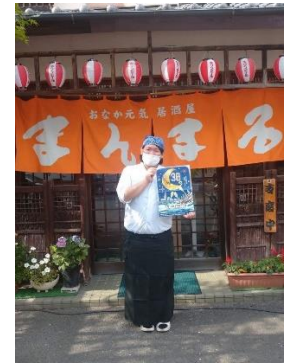
おなか元気居酒屋まんまるさん（久留米市）