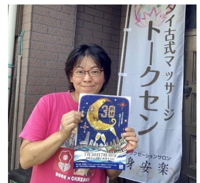
リラクゼーションサロン身安楽 さん（岡崎市）