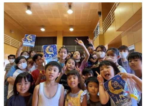
大牟田 Happy mama プロジェクト おやこ食堂