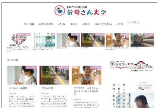
お母さん大学サイト