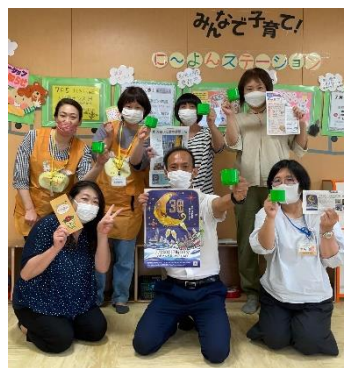
大阪市西淀川区に〜よんステーション