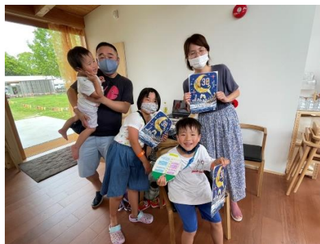
お母さん大学生の野中ファミリー