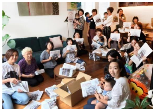
毎月開催されている折々おしゃべり会