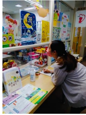
子育て支援センター（福岡県）の窓口に