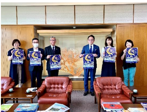
辰巳商会西社長と、深田サルベージ建設の山本社長