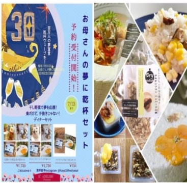
乾杯限定商品を発売中（K'sDELISH）