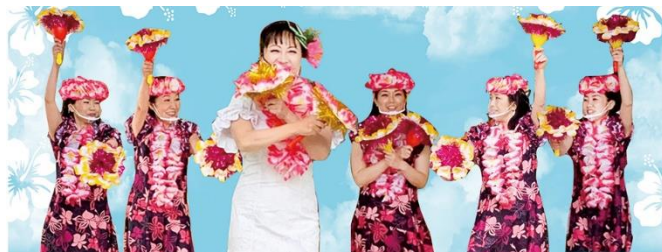
母フラ de ピンクリボン