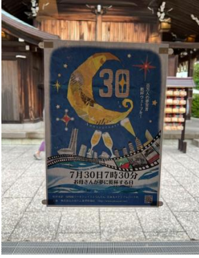
横浜水天宮の待合室に