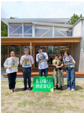
久留米中央公園「くるめる」