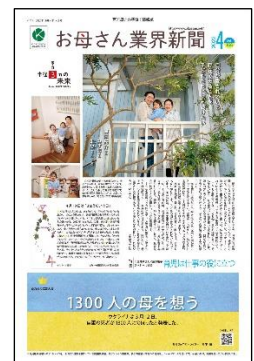
お母さん業界新聞