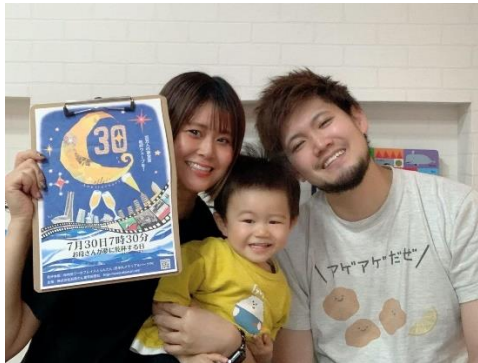
お母さん大学生の高田ファミリー